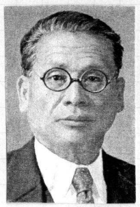
九、 遠藤先生 華田壽詩記念論文集 集（還曆詩記公

著書に『社會史論』（明治二十八年八月二十六日同文館）、『發音と表情』（明治四十一年二月九日社會學研究所・弘道館「日本社會學研究所論集」）、『新論語』（合著・成功雜誌社編、明治四十二年六月十日成功雜誌社）、『東洋倫理研究』（明治四十四年二月六日弘道館）、『理想の人物』（大正二年一月二十八日金尾文淵堂）、『道徳と品性』（大正五年四月十日廣文堂書店）、『易の原理及占筮』（大正五年十二月五日明誠堂書店）、『三田社會學會講演集・第一輯』（合著、大正九年十一月十八日三田社會學會）、『人間生活の實現』（大版・大正十二年二月十五日教文社）、『人文東洋主義と社會改造』（大正十二年十一月二十日教文社）、『老子を讀む』（今日小在らしかば）（大正十四年二月二十八日早稲田大學出版部）、『孝經及東西洋の孝道』（昭和十一年十月一日築園學舎出版部）、『大東策』（昭和十四年十一月二十五日築園學舎出版部）等。