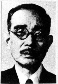
大東文化大學漢學會