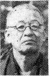
來城漢稿刊行會編、昭和九年五月十五日福岡刊）等。